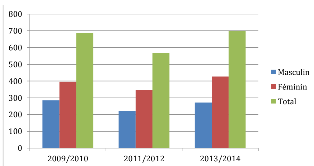
Graphique : Répartition par sexe